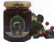
クリスマスベリー (カウアイ島)

夏の間に小さな黄緑色の花をつけ、ちょうど冬のホリデーシーズンが近づくころになるとスパイスにもなる赤い実をつけるブラジリアンペッパーツリー。ハワイではクリスマスに人気のある植物です。そのハチミツは赤みがかった個性的な琥珀色。黒糖のような豊かな風味と、プルーンのようなフルーティで深い味わいが特徴です。最近では、抗酸化作用をもたらすORAC®値の高さが米国シカゴ大学の論文でクローズアップされ注目を集めています。*ORAC (Oxygen Radical Absorbance Capacity=活性酸素吸収能力)は、食品に含まれる抗酸化物質の能力を示す指標、高いほど抗酸化力が強いことを示します。